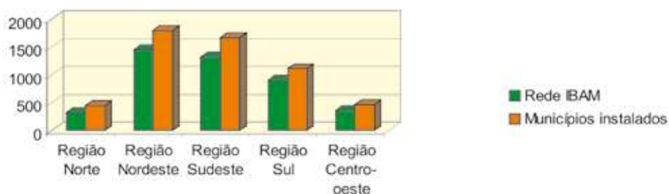
Municípios da Rede IBAM, por Região